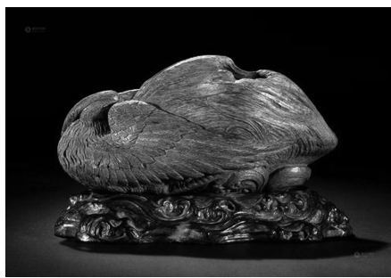
沉香木雕鸳鸯暖手

明清雕刻作品中,木雕工艺的主题常为生活风俗、神话故事。现存于世的木雕作品“沉香木雕鸳鸯暖手”,即是代表作之一。