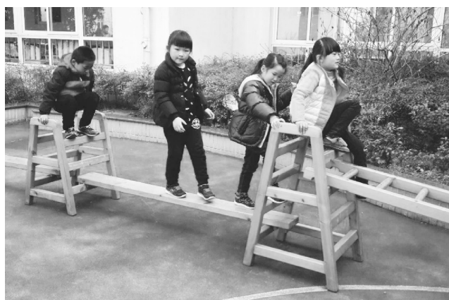
图 1-20 木制平衡木