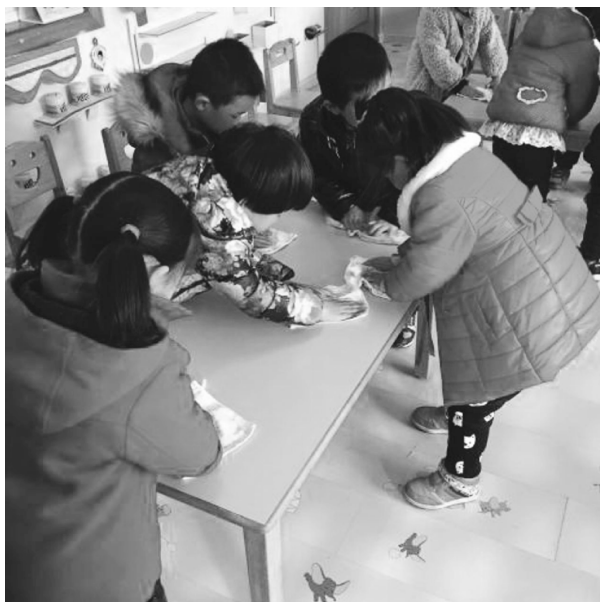
图 1-13 幼儿擦桌子