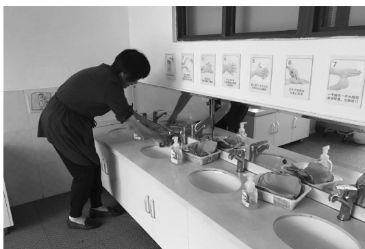
图 1-5 洗漱间展示正确的洗手图示