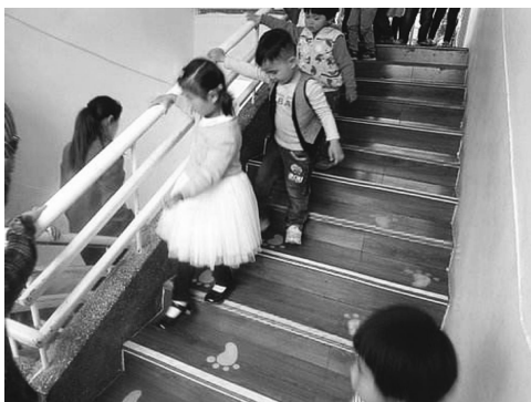
图 1-4 楼梯上指示上、下的脚印