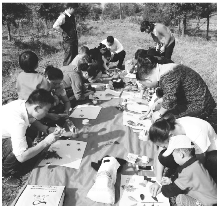
图 1-9 幼儿亲子活动“发现秋天”