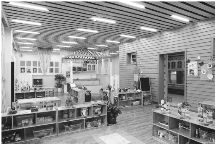
图 1-21 幼儿园环境创设

传统幼儿园环境创设更多地关注外观上的“装饰性”,而忽略内在教育价值上的“审美性”,使有些幼儿园环境表面上看起来“丰富多彩”“琳琅满目”,实际上却是杂乱无章的堆砌,毫无章法,更谈不上美观。这样的环境不仅不能促进幼儿的发展,甚至还限制和阻碍了幼儿的发展。因此,幼儿园环境创设要注意整体风格一致,比如主题墙饰和区域墙饰,要进行统一规划,在色彩上、造型上和构图上不仅要搭配协调,还要与环境的教育性和谐融合,达到局部美与整体美的有机统一。美的环境能让孩子眼前一亮,陶冶其情操,唤醒其创造美的意识,如图 1-21 所示。