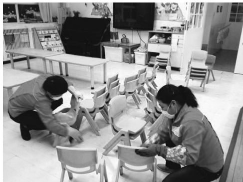
图 1-2 幼儿园桌椅消毒