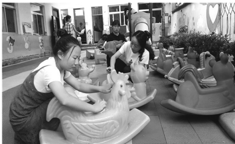
图 1-3 幼儿园玩具清洗