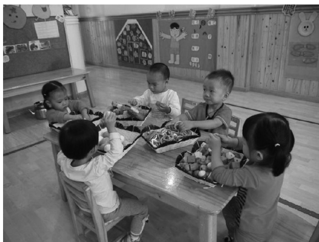
图 1-6 幼儿园小班玩具