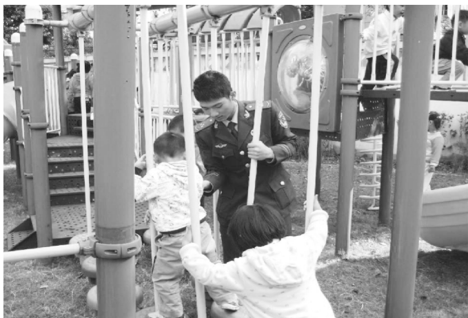
图 1-10 社区武警走进幼儿园