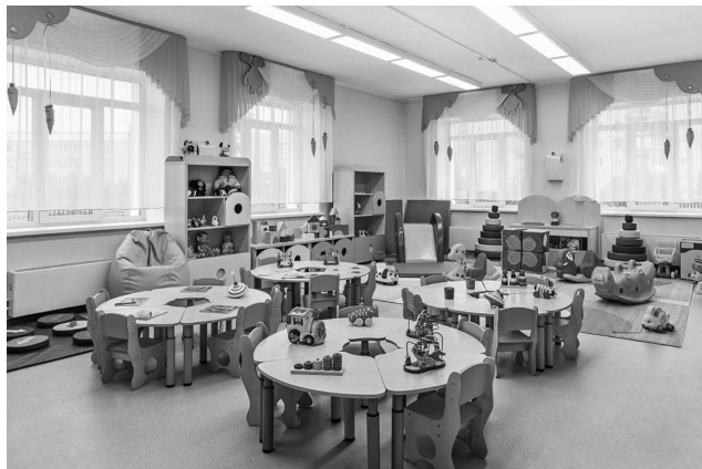
图 1-7 幼儿园中、大班玩具