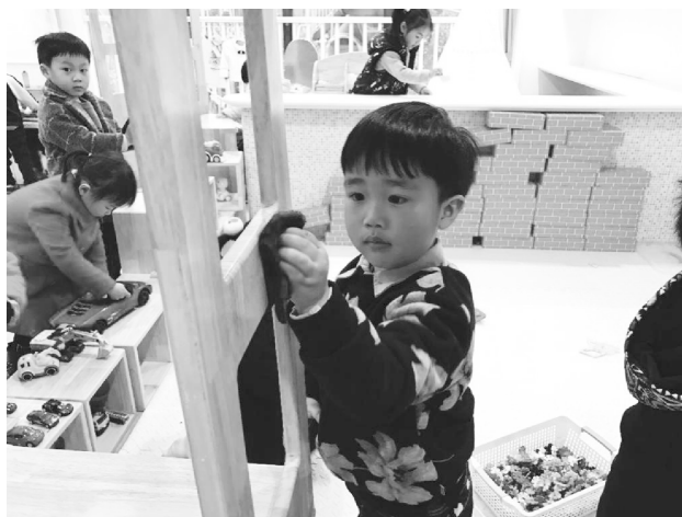
图 1-14 幼儿打扫活动室