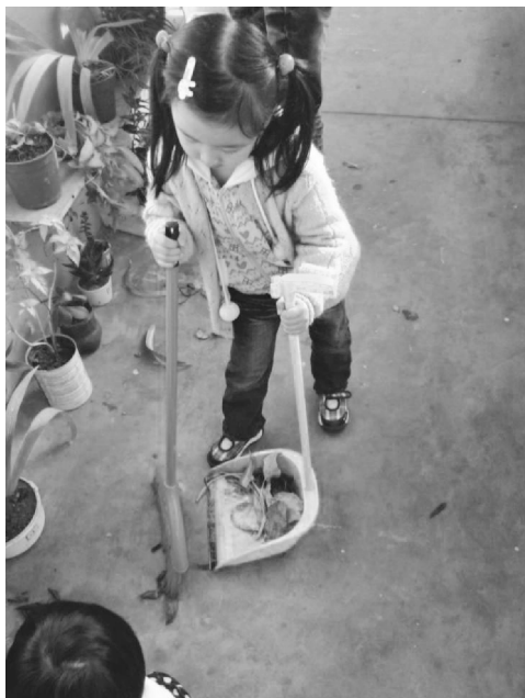
图 1-12 幼儿参与打扫卫生

幼儿参与环境的创设,能切实地体验到自己做的事对集体的影响。比如大家一起收拾活动室,擦桌子、扫地、整理玩具,把活动室打扫得干干净净,参与这一过程会使幼儿真真切切地感到自己在集体中的作用,如图 1-12 至图 1-14 所示;而如果自己负责的桌子没擦干净,影响了活动室的清洁,也会让幼儿体会到责任意味着什么。如果没有亲身参与,这个环境与自己无关,幼儿就不会真正去关心,也不会理解什么叫责任。我们常常可以见到,对于活动室墙上教师精心绘制的非常精美的儿童画,幼儿刚看到时还感到新鲜,过不了多久就视而不见了。哪怕上面贴的什么东西掉下来了,或者画已经过时了,也无人问津。但假如由幼儿分组轮流负责布置的话,就会是另一番景象。