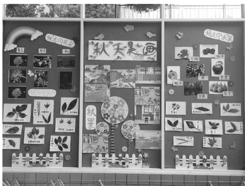
图 1-16 秋季主题墙

临,让幼儿取下叶子,换上白色的棉花,表示积雪,并剪贴出漫天飞舞的雪花和落满白雪的青松。这样,四季的景色在幼儿的参与下动态地生成。秋季主题墙创设示例如图 1-16 所示。此外,主题内容的生成还应随着幼儿的兴趣和问题的变化而变化。例如,有的孩子对温度没有直接经验,就会有“今天好热呀,有 80℃!”这样的错误表达,教师应及时捕捉到这一信息,从而生成关于天气的主题活动,天气主题墙如图 1-17 所示。