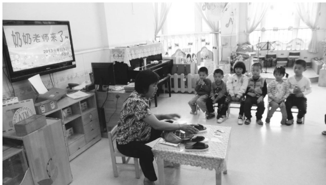
图 1-11 家长走进课堂