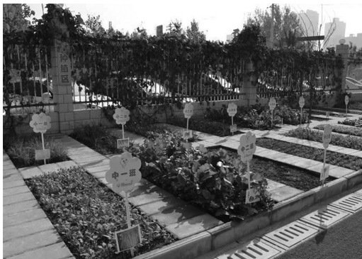
图 1-1 幼儿园种植区

安全性原则是幼儿园环境创设的首要原则,安全的环境是适宜幼儿发展的必备条件,在安全的环境里,幼儿的生命才能获得保障,幼儿才能快乐地学习、成长。这里的安全包含两个方面,一是心理的安全,二是身体的安全。心理的安全主要指良好的师幼关系、同伴关系以及合理的生活制度与要求等。例如,幼儿能深切地感受到教师是很关心和爱护他的,小伙伴是欢迎和接受他的,幼儿能在幼儿园得到大家的尊重,感受到像在自己家里一样的温暖。身体的安全主要指的是避免外界物质对幼儿身体的伤害。这主要从两方面着手:一是设施、设备、材料本身是安全的。例如,废旧物品制作的玩具不能对幼儿造成伤害;安排的场地空间要合理,它们之间要互相干扰;所种的花草要既漂亮,又无毒、无危险,比如夹竹桃、仙人球之类就不宜在幼儿园种植(幼儿园种植区如图 1-1 所示);室内、寝室要安装紫外线灯或用消毒水消毒等。二是对设施、设备、材料的位置摆放要是安全的。电线、开关和插座应安放在幼儿手不可及的地方;防护装置应符合安全要求,如吊扇使用前要对其稳定性进行检查;易碎品或玻璃制品不可当挂饰或吊饰;危险物品或具有潜在危害的物品,像消毒液、洗衣粉、外用液等,应放在幼儿触及不到的地方;购买室内玩具时也要注意,比如尖锐的、细小的、射击用的(枪)等,都有危险;一些“三无”塑料玩具也存在安全问题。另外,玩具还要经常清洗,保持整洁。幼儿园桌椅消毒、玩具清洗如图 1-2、图 1-3 所示。