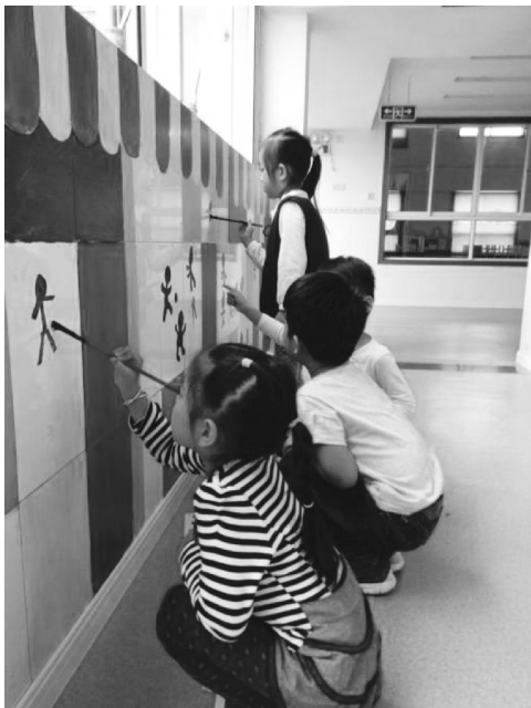
图 1-15 幼儿参与环境创设