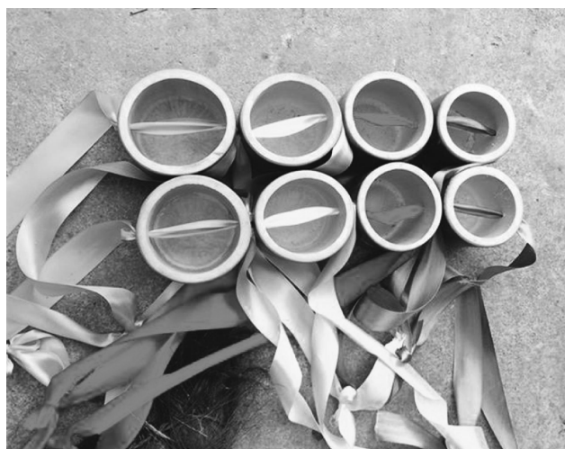
图 1-19 竹制高跷