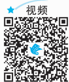
运动损伤的急性处理

(8)参加篮球、足球等项目的训练时,要学会保护自己,不要在争抢中蛮干而伤及自己或他人。