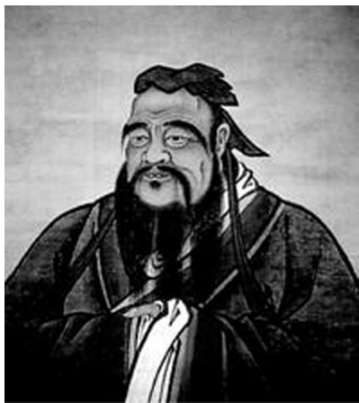
图 1-1 孔子像

礼仪的变革时期为春秋战国时期(公元前 771—前 221 年)。在这一时期,中国的奴隶社会逐步瓦解,封建社会逐步形成。中国古代文化迅速发展,相继涌现出孔子、孟子、荀子等思想巨人。“百家争鸣”现象的出现也推动了中国礼仪和文化的发展与革新。孔子曰:“不学礼,无以立。”孔子对礼仪非常重视,把“礼”看成是治国、安邦、平定天下的基础(见图 1-1)。孟子提出的“仁、义、礼、智”成为当时的道德规范(见图 1-2)。荀子把“礼”作为人生哲学思想的核心,把“礼”看作是做人的根本目的和最高理想,认为“礼者,人道之极也”,他认为“礼”既是目标、理想,又是行为过程。在这些伟大的思想家的推动下,礼仪也得到了很大的发展和变革。