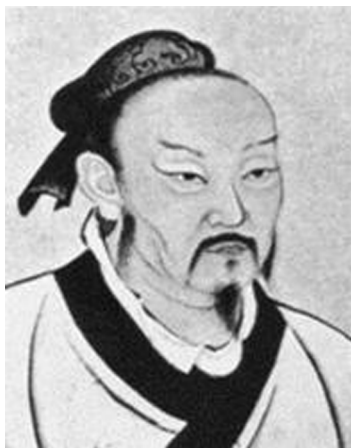
图 1-2 孟子像