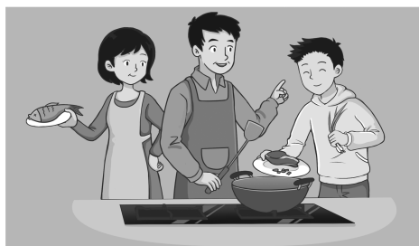
▲ 生活自理劳动涵养感恩之心