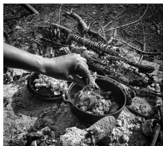
▲ 生活自理劳动提高生存能力

俗话说,不当家不知柴米贵,不养儿不知父母恩。通过生活自理劳动可以更好地体验父母的辛劳,从而增进亲子感情。同时,常怀感恩之心对今后与他人、与自然共处也大有帮助。