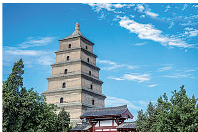
图 0-18 大雁塔