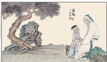
图 0-25 华佗问诊