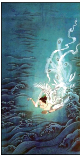
图 0-3 精卫填海