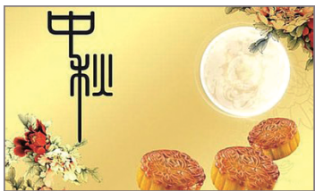
图 0-27 中秋佳节