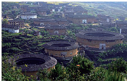
图 0-20 福建土楼