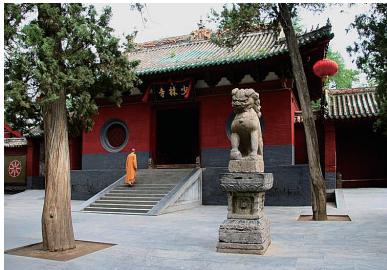
图 0-19 少林寺