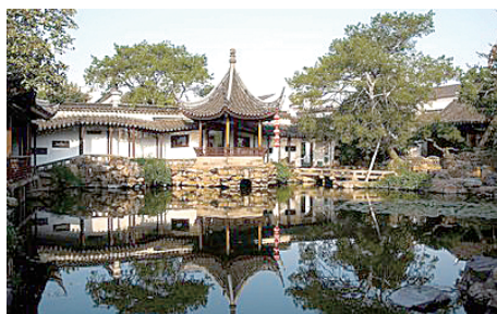
图 0-17 拙政园