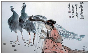
图 0-4 《孔雀东南飞》