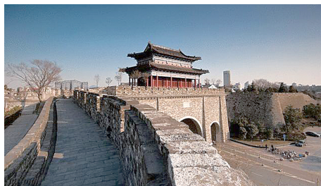
图 0-15 南京古城墙