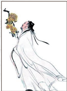
图 0-5 陶渊明《归园田居》