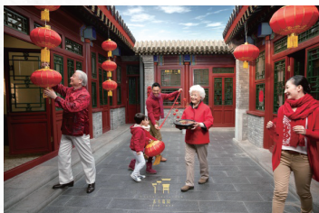
图 0-26 中国春节