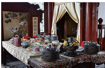
图 0-24 宫廷饮食