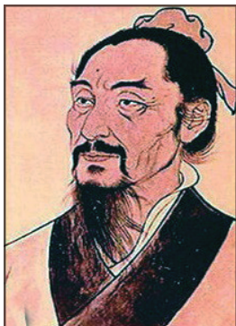
图 0-10 墨子