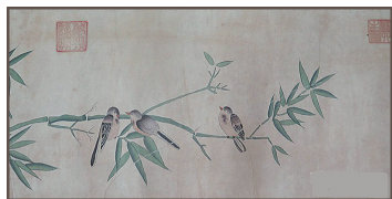
图 0-23 阎立本《花鸟画长卷》