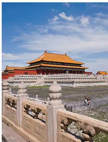
图 0-12 故宫