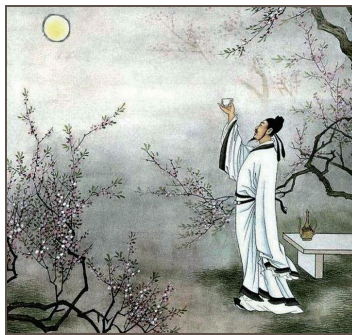
图 0-6 李白《月下独酌》

(5) 唐宋元时期的诗、词、曲 出现了唐代三大诗人:李白、杜甫、白居易,宋词四大代表人物:苏轼、李清照、辛弃疾、柳永,以及元曲四大家:关汉卿、王实甫、马致远、白朴等。