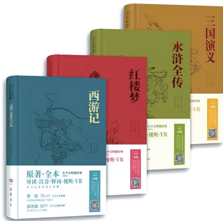
图 0-7 四大名著

(6) 明清时期的小说 有四大名著:《西游记》《红楼梦》《水浒传》和《三国演义》。