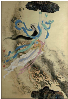
图 0-1 女娲补天