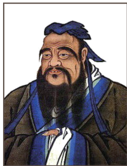
图 0-8 孔子

(3) 以墨子为代表的墨家思想 注重逻辑思维能力的培养和实用技术的传习。主张人与人之间平等的相爱(兼爱),反对侵略战争(非攻),推崇节约、反对铺张浪费(节用),重视继承前人的文化财富(明鬼),掌握自然规律(天志)等。