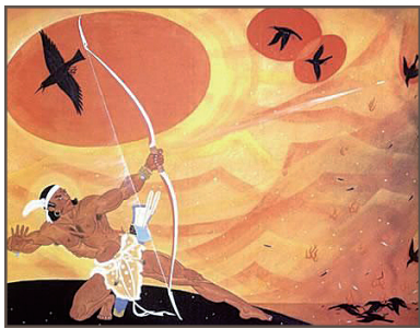
图 0-2 后羿射日

(2) 先秦时期的散文 包括历史散文,如《尚书》《春秋》《左传》《战国策》等,诸子散