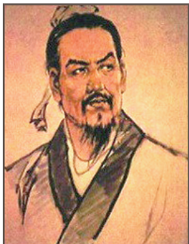
图 0-11 韩非子