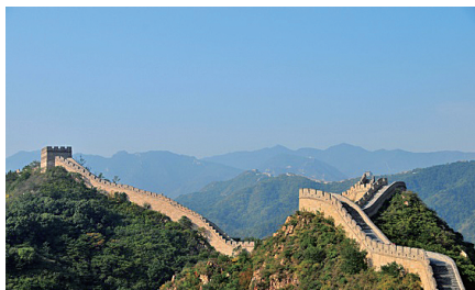
图 0-14 万里长城