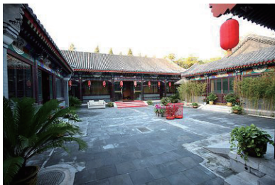
图 0-21 北京四合院