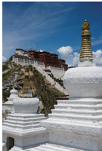
图 0-13 布达拉宫