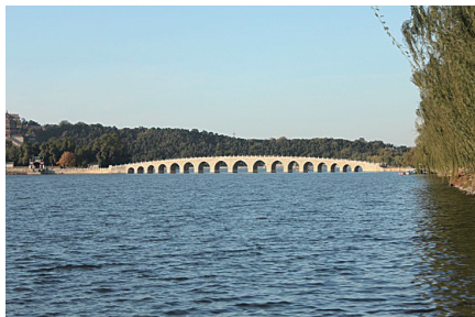
图 0-16 颐和园