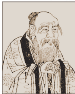
图 0-9 老子

(4) 以韩非为代表的法家思想 主张以法治国,不别亲疏,不殊贵贱,一断于法。经济上主张废井田,重农抑商,奖励耕战;政治上主张废分封,设郡县,君主专制,仗势用术,以严刑峻法进行统治;思想和教育方面,则主张禁断诸子百家学说,以法为教,以吏为师。其学说为君主专制的大一统王朝的建立,提供了理论根据和行动方略。