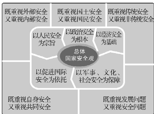
总体国家安全观的五大要素、五对关系示意图

总体国家安全观立足当下、展望未来、格局宏大，确保国家的稳定与持续发展是我国国家安全的头等大事，体现了强烈的忧患意识、清醒的底线思维和勇毅的担当精神。对内，强调发展是安全的基础，富国才能强兵；对外，倡导实现共同、综合、合作、可持续的安全。必须全面、准确理解总体国家安全观的丰富内涵，辩证看待国家安全外延的创新发展，要从全局和战略的高度审视国家安全问题，统筹不同领域、不同性质的安全工作，形成维护国家安全的强大合力。