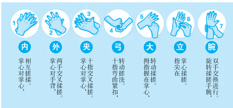
图 1-2-5 七步洗手法