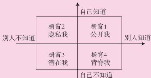
图 1-1 坐标橱窗图

橱窗 4 是“背脊我”。如果一个人诚恳地、真心实意地征询他人的意见和看法，就可以了解“背脊我”。