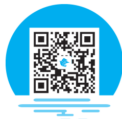
高校校园安全现状

近年来,随着高等教育改革和高校建设步伐的加快,高校对外交流的机会较多,办校规模扩大,招生人数增加,高校及其周边治安状况日趋复杂,各类刑事、治安案件时有发生,不安全因素增多。公安机关统计的资料显示,各高校刑事、治安案件的发生率,案件涉及的人员数量等都在持续增长。从涉案情况来看,社会不法分子主要侵害大学生的人身、财产安全和学校固定资产安全。校园安全重如泰山,高校治安问题的日趋严重受到了社会、大学生及其家长的高度关注,也给高校治安管理带来了很大压力。从总体上看,高校校园不安全的状况主要体现在以下几个方面。