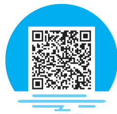
高校校园安全现状

近年来,随着高等教育改革和高校建设步伐的加快,高校对外交流的机会较多,办校规模扩大,招生人数增加,高校及其周边治安状况日趋复杂,各类刑事、治安案件时有发生,不安全因素增多。公安机关统计的资料显示,各高校刑事、治安案件的发生率,案件涉及的人员数量等都在持续增长。从涉案情况来看,社会不法分子主要侵害大学生的人身、财产安全和学校固定资产安全。校园安全重如泰山,高校治安问题的日趋严重受到了社会、大学生及其家长的高度关注,也给高校治安管理带来了很大压力。从总体上看,高校校园不安全的状况主要体现在以下几个方面。