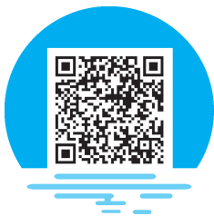
大学生常见心理问题及应对策略

在我国社会发展的历史进程中，随着我国教育的不断发展，越来越多的适龄青年有机会进入大学，接受高等教育，同时大学生也渐渐走出了“天之骄子”和“栋梁之材”的光环，回归到现实生活。