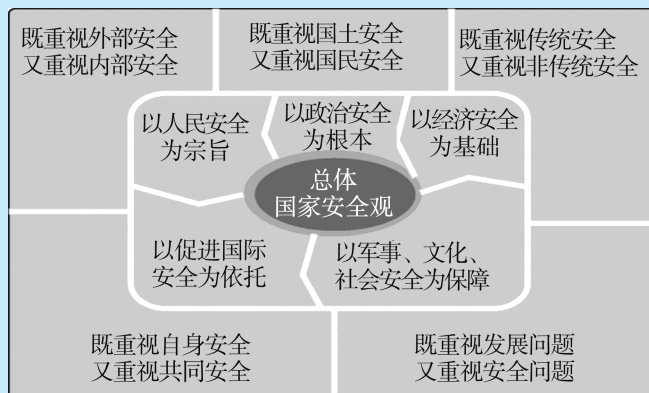
图 1-1 总体国家安全观的五大要素、五对关系示意图