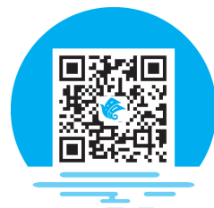
高校校园安全现状

近年来,随着高等教育改革和高校建设步伐的加快,高校对外交流的机会增多,办校规模扩大,招生人数增加,高校及其周边治安状况日趋复杂,各类刑事、治安案件时有发生,不安全因素增多。公安机关统计的资料显示,各高校刑事、治安案件的发生率、同比增长率,案件涉及的人员数量等都在持续增长。从涉案情况来看,社会不法分子主要侵害学生的人身、财产安全和学校重要固定资产安全。校园安全重如泰山,高校治安问题的日趋严重受到了社会、学生和家属的高度关注,也给学校治安管理带来了很大压力。从总体上看,高校校园不安全的状况主要体现在以下几个方面。