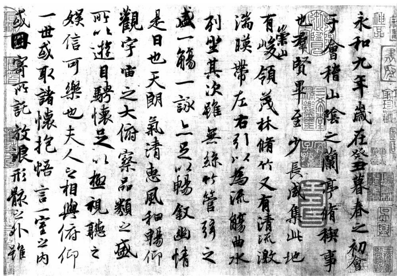
晋·王羲之《兰亭序》选字