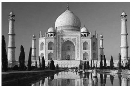
图 1-17 泰姬陵