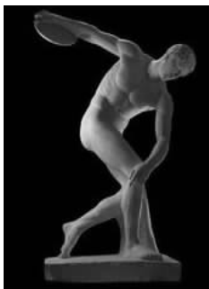
图 1-12 《掷铁饼者》