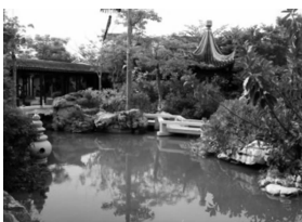
图 1-14 苏州园林

建筑物是人们建造的能够居住和活动的场所,使用价值是建筑的首要特点。建筑艺术属于空间造型艺术,与其他美术形式相比更要满足实用、坚固、美观这三个要求,并与环境相互配合,协调一致,融为一体,形成建筑特有的空间美。随着劳动生产力的发展和进步,人类对建筑的需求也不局限于此。人们需要美的居住环境,建筑艺术的审美价值也越来越被重视。像苏州园林(见图 1-14)、西班牙天主教堂(见图 1-15)、迪拜第一高塔(见图 1-16)都淋漓尽致地展现着艺术之美。建筑艺术还是人类文化的结晶,像印度的泰姬陵(见图 1-17)、沙特阿拉伯的麦加皇家钟塔饭店(见图 1-18)充分地展示了建筑艺术中的宗教文化价值。