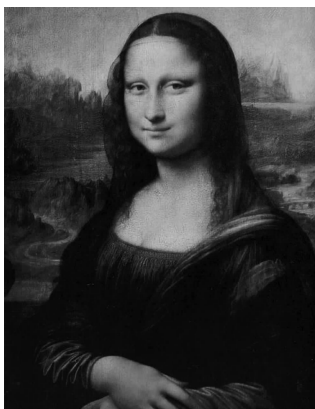
图 1-31 《蒙娜丽莎的微笑》