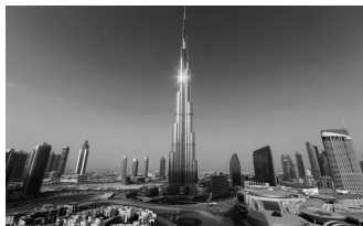
图 1-16 迪拜第一高塔