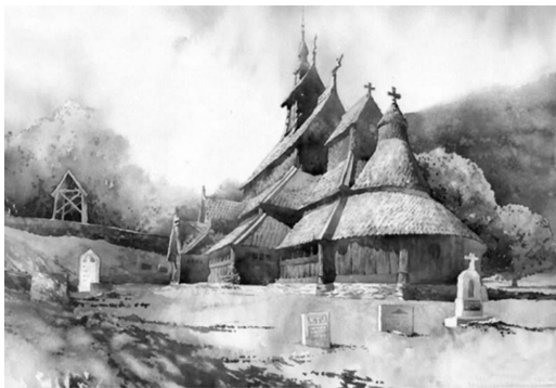
图 1-7 建筑水彩画

建筑题材的水彩画历史悠久,出于职业性的审美爱好和需要,它们更受到建筑师们的青睐。当然它们也是许许多多水彩画爱好者所热衷的题材。优秀的建筑本身就是精美的艺术,它不仅以其尺度、比例、色彩、装饰以及变幻的光影效果等形象因素引起人们感观上的审美体验,而且通过形象传达着某种精神内涵(见图 1-7、图 1-8)。