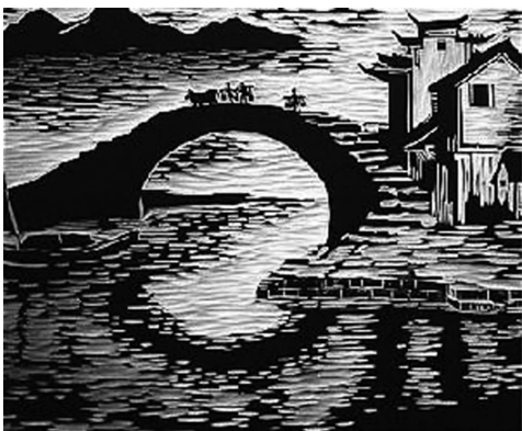
图 1-9 版画