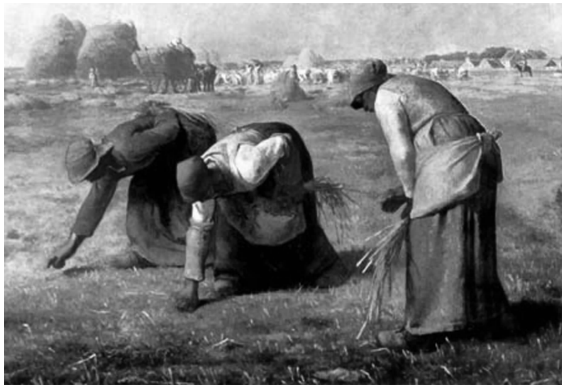
图 1-3 《拾穗者》

彩搭配上的巨大创造力。这幅作品在寻求音乐与美术之间的联想的同时,把沃尔特·佩特称之为“音乐的特性”的东西用绘画的方式表现了出来。画面上并没有明示出音乐家们与听众之间存在着什么联系,更看不出四位演奏家有什么特别之处,但是作品的意图表现得非常突出。