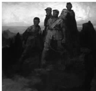
图 1-28 《狼牙山五壮士》

鲁迅说:“美术可以辅翼道德。”美术作品所表现出来的内容和主题对人的身心健康、人生观的认识起到重要的教育作用。因为艺术家们在创作过程中,不仅可以反映现实,而且还会对社会现实生活作出评价,由此提出自己的理想和愿望,表达自己对人生与世界的体验和感受。例如,詹建俊的《狼牙山五壮士》(见图 1-28)无疑能激发起人们的爱国主义精神和热情。这是通过形象的感染与激发效能,启发观者的意识与情意活动,从而达到提高思想、品德和情操的目的。