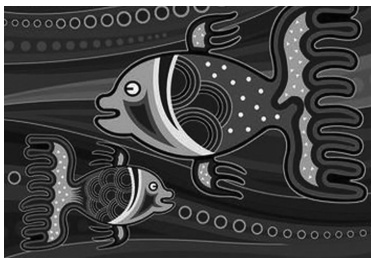
图 1-19 民族装饰画

如装饰画、玉器、牙雕、珠宝首饰、琉璃制品、景泰蓝等(见图 1-19~图1-24)。