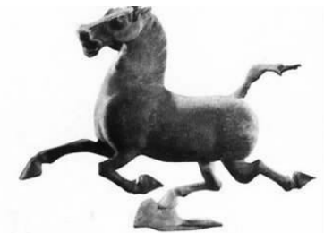
图 1-13 《马踏飞燕》