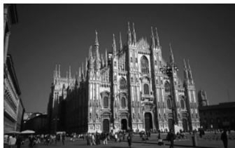
图 1-15 西班牙天主教堂