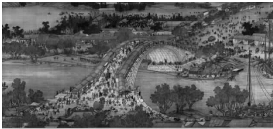
图 1-29 《清明上河图》(局部)

美术是社会现实生活的反映,是人们对社会生活、对世界的一种认识。美术以及其他一切艺术形式都不是超然于现实而与社会生活隔绝的,都是客观世界的反映,是人们对社会生活方式运用视觉形象进行的创造性的想象活动。例如,张择端的《清明上河图》(见图 1-29)呈现出来的画面生动地再现了北宋汴京城和平时期的繁荣景象,表现了宋代人们的衣食住行,通过观察可以使人们了解中国宋代的社会生活与风俗,从而可以从更清晰地认识到生活的本质。