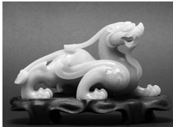
图 1-20 中国古玉器玉龙