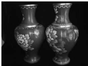
图 1-24 景泰蓝花瓶