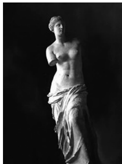
图 1-11 《米罗的维纳斯》

由于雕塑材料的特殊性,雕塑作品成为一种三维空间的实体创造。洛朗斯曾指出:“雕塑实质上是占有一个空间,用凹陷和体量、丰富和空虚来构造一个物体,即用这类对立因素相互之间的变换、对比和坚定而相互补充的紧张感来构造一个物体,而在最后获得的形式中,则必须表现这些因素相互之间的平衡。”例如,《米罗的维纳斯》(见图 1-11)即是女性美的最高典范。雕塑还是静态空间的形象,如古希腊雕塑家米隆的《掷铁饼者》(见图 1-12)刻画了掷铁饼者的预备动作和掷饼动作之间的过渡状态中,手掷铁饼向后甩起到最高点的这一瞬间动作,预示了掷饼时力量方向的转换。我国东汉时的雕塑《马踏飞燕》(见图 1-13)刻画了天马飞速奔驰时马头微昂,三蹄腾起,一蹄踏着飞燕,长尾飘举的状态,整个造型给人神采飞动、矫健俊逸之感,象征着乐观自信、奋发向上、一往无前的精神。