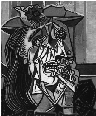
图 1-1 《哭泣的女人》

艺术美是指艺术作品的美。艺术美是艺术家通过自己的思考和探索对自然美和社会美再创造的产物。艺术美是艺术家情感和自然美、社会美的融合，它更纯粹鲜明地展现了现实世界的“美与丑”，因此艺术美是形式美和内在美的统一。艺术的形式美主要通过艺术作品的线条、色彩、形体等要素表现出来；而艺术的内在美则是艺术作品所表达的审美情操、信念与理想。艺术美不是意味着艺术作品再现的对象要有“视觉上的美感”，如毕加索的《哭泣的女人》（见图 1-1）这幅作品，刻画了一个极其悲伤的女人，悲凄的命运和感情由粗放的颜色和劲利的笔触反映出来。人物的眼睛、嘴唇、鼻子似乎杂乱无章，支离颠倒，具有常人难以理喻的特点。但这幅人物画却是毕加索的不朽巨作之一。女人脸部扭曲和断裂的方式是立体派手法的一个发展。他在艺术里果断地把丑化为美，同时又在现实中义无反顾地使美向丑沉沦。这种艺术形式使这件艺术品具有无穷的意味，具有了极高的审美价值。从这个角度说，艺术美是一种高级形态的美。