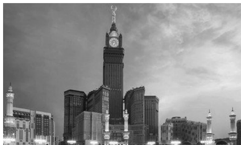
图 1-18 麦加皇家钟塔饭店