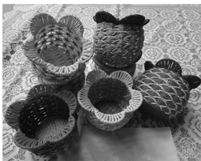
图 1-27 植物编织