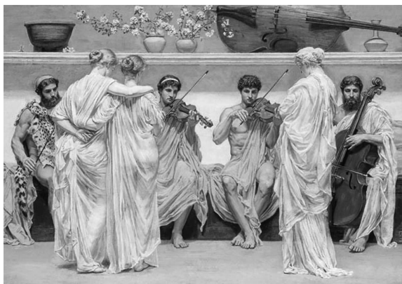
图 1-4 《四重奏:一个画家对音乐艺术的赞颂》