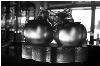
图 1-23 喜事(柿)连连