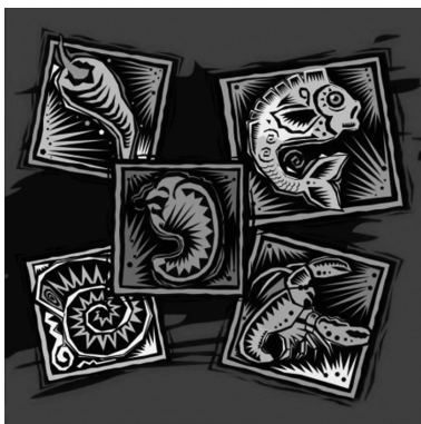
图 1-10 版画