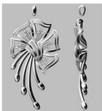
图 1-22 水贝珠宝首饰