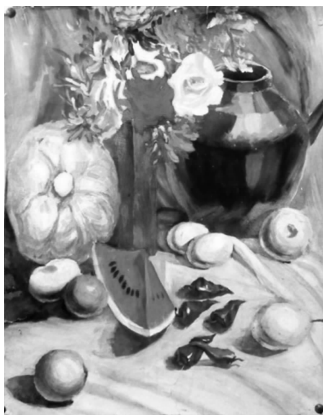
图 1-6 静物水彩画

繁多,形式多样,色彩丰富,艺术家可以根据自己的意图有意安排所需要的内容和构图,从而创作出意味深长的静物画作品(见图 1-6)。