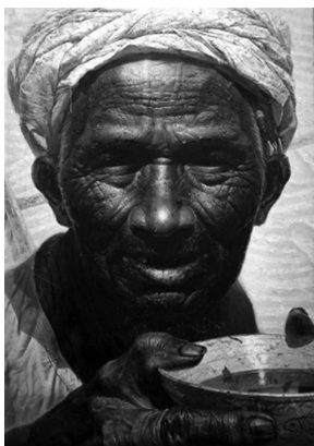
图 1-30 《父亲》

美术既能反映现实美,又能创造艺术美。所谓现实美,是指现实中各种事物的美;所谓艺术美,是指艺术作品的美,由创作主体按照一定的审美目标、审美实践要求和审美认识的指引,根据美的规则所创造的一种综合美。例如,油画画家罗中立的《父亲》(见图 1-30),其笔下浓厚的油彩和西方现代艺术中超写实的手法巧妙地结合,采用了特写构图,精微而细腻的笔触,甚至可见淋漓的汗水从脸上的毛孔中渗出,塑造出了一个感情真挚、纯朴憨厚的父亲的形象。作品背景运用土地原色呈现出金黄,来加强画面的空间感,体现了父亲外在的质朴美和内在的高尚之美。又如,文艺复兴时期画家达·芬奇所绘的《蒙娜丽莎的微笑》(见图 1-31),成功地塑造了资本主义上升时期一位城市资产阶级的妇女形象。画中人物坐姿优雅,笑容微妙,背景山水幽深茫茫,淋漓尽致地发挥了画家那奇特的烟雾状“无界渐变着色法”般的笔法。画家力图使人物的丰富内心感情和美丽的外形达到巧妙的结合,对于人像面容中眼角唇边等表露感情的关键部位,也特别着重掌握精确与含蓄的辩证关系,达到神韵之境,从而使蒙娜丽莎的微笑具有一种神秘莫测的千古奇韵,那如梦似的妩媚微笑,被不少美术史家称为“神秘的微笑”。我们可以从这些美的创造中获取到全身心的审美满足和巨大的精神力量。