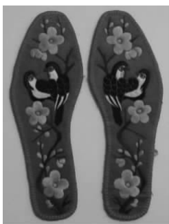
图 1-26 手工刺绣鞋垫