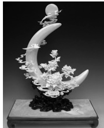
图 1-21 牙雕“锦上添花”