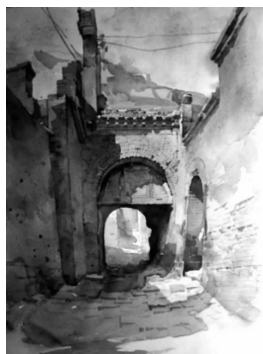
图 1-8 建筑水彩画

(4) 版画。版画是视觉艺术的一个重要门类。当代版画的概念主要指由艺术家构思创作并且通过制版和印刷程序而产生的艺术作品。版画在历史上经历了由复制到创作两个阶段:早期版画的画、刻、印者相互分工,刻者只照画稿刻版,称为复制版画;后来画、刻、印都由版画家一人来完成,版画家得以充分发挥自己的艺术创造性,这种版画称为创作版画(见图 1-9、图 1-10)。