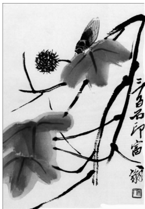
图 1-2 齐白石水墨画作品

(2)油画。油画是西洋绘画的代表,是西方绘画中的主要画种之一。它是用油调和油质颜料在特制的布、木板、厚纸和墙壁上作画的一种绘画方式。油画一般重形似、重再现、重塑性,常运用焦点透视以面塑性,油画颜料具有较强的遮盖力,色彩丰富,能充分地表现物体的色彩变化,极富真实感。画家们引进科学成就,如数学、解剖学、透视学、色彩学等来帮助塑造真实的艺术形象。艺术的题材强调透过酷似生活形象的人物的动作、姿态、表情来表达客观物象本身的