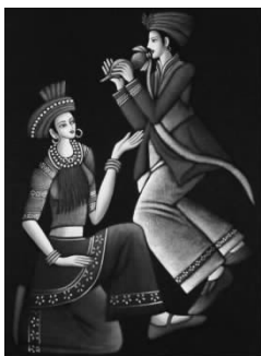
图 1-25 蜡染贵州苗寨风情

传统手工艺美术选料精良,制作精美细致,手工单件制作。其特点是有很大的不可复制性,艺术风格有较强的传统文化特色和鲜明的地域特点,技术过程也较多地延续了传统的方法和技艺。比如,贵州蜡染便是我国苗族传承下来的优秀的传统手工艺美术(见图 1-25),还有手工刺绣工艺(见图 1-26)、竹草编织工艺(见图 1-27)都是我国传统的手工艺美术。