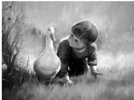
图 1-5 水彩画

(3)水彩画。水彩画是西方绘画中别具风格的画种。水彩画在题材选择方面是十分广泛的,风景画是水彩画家们非常青睐的一种题材,大自然为人们呈现出无比丰富而生动的色彩,无论是温暖绚丽的阳光还是深沉辽阔的海洋,无论是明媚斑斓的花木还是清冷阴霾的云朵,无不唤起艺术家内心的色彩冲动和表现欲望。钟情于大自然的画家永远不知疲倦地通过风景画来表达他们的色彩世界(见图 1-5)。