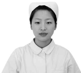
图 1-3-2 燕帽