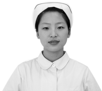
图 1-3-3 护士长

(2) 燕帽:普通病室和门诊室可以选择燕帽,燕帽造型甜美、纯真、可爱,像白色的光环,圣洁而高雅,是护士职业的象征。燕帽边缘的彩道多为蓝色,象征严格的纪律,是责任和尊严的标志,同时代表了一定的含义:横向的蓝色彩道是职务高低的象征:一道横杠是护士长(图 1-3-3),两道横杠是总护士长(图 1-3-4),三道横杠是护理部主任(图 1-3-5);斜行的蓝色彩道是职称高低