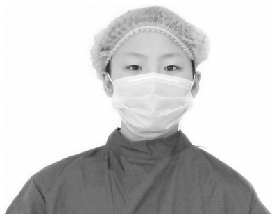
图 1-3-1 圆帽

护士帽被赋予高尚的意义,要求洁白无皱。护士帽分为圆帽(图 1-3-1)和燕帽(图 1-3-2)。使护士的着装更加美丽大方,显示了护士特有的精神风貌。