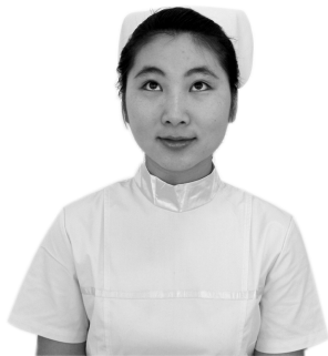
图 1-2-3 仰视

(4) 俯视:可表示长辈对晚辈表示宽容、怜爱,也可对他人表示轻蔑、歧视(图 1-2-4)。