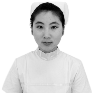
图 1-2-1 平视