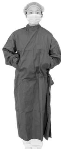
图 1-3-8 手术服