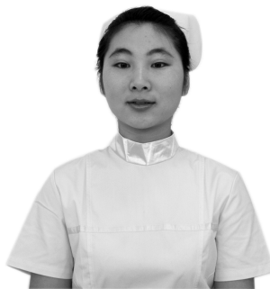
图 1-2-4 俯视