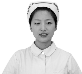
图 1-3-4 总护士长