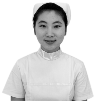
图 1-2-5 护士笑容

在以上六种常规的笑容中,前四种比较常见,并以微笑最受欢迎。微笑是最自然、最大方、最富吸引力、最令人愉悦、最有价值、最为真诚友善的面部表情,为世界各国民族所认同;微笑是一种特殊的语言,不仅能传递愉悦、友好、和善的信息,而且还能表达歉意、谅解,它沟通了人们的心灵,架