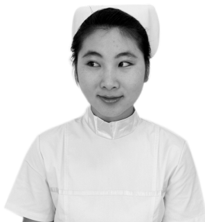
图 1-2-2 斜视