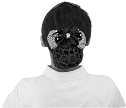
图 1-1-1 护士发网佩戴

一个人头发的长短本不应当强求一律,但从礼仪和审美的角度看,仍受到若干因素的制约,因此,不能一味地讲究自由、个性而不讲规范。比如很多行业对头发的长度都有明确的要求。野战军战士为了受伤后便于抢救,通常被要求理光头。而商界有些部门则要求女士头发不宜过肩,不提倡留披肩长发。偏爱披肩发者,在工作岗位上要将头发盘起,要求前面不遮挡双眼,后面不过肩。男士不宜留鬓角,不准留长发,梳小辫,前不过额头,发帘最好不要长过 7 cm,即大致不触及衬衫领口;若无特殊宗教信仰、文化背景和民族习惯,原则上不准蓄胡须。护士头发的长度比商界要求更严格,在工作中,要求前发齐眉,且不超过眉毛,后发不过肩,以齐耳垂下沿为好,发长过肩者必须用发网束于脑后(图 1-1-1)。