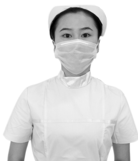
图 1-3-10 口罩配戴方法