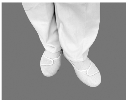
图 1-3-9 护士鞋

工作时应穿白色低跟、软底防滑、大小合适的护士鞋,这样护士每天在病区不停地行走时,既可以防止发出声响、保持速度,又可以使脚部舒适、减轻疲劳。禁止穿高跟鞋、硬底鞋或带钉、带响的鞋,因为这样会使自己行走时容易疲劳,而且也会影响病人休息。工作鞋应经常刷洗,保持洁白干净。无论下身配穿工作裤或工作裙,袜子均以浅色、肉色为宜,以与白鞋协调一致。穿工作裙服时,长袜口一定不能露在裙摆外。别小看一双工作鞋,不光穿着轻快,结合整体更可以给人以利索俊美之感(图 1-3-9)。那可是给你的英姿添彩的一笔啊!