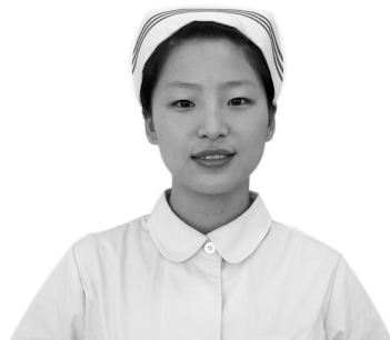
图 1-3-5 护理部主任