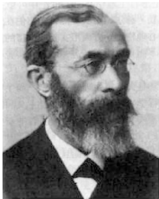
德国心理学家威廉·冯特 (Wilhelm Wundt, 1832—1920)

德国心理学家冯特(图1-1),1879年在莱比锡大学建立了世界上第一个心理学实验室,这被看作是科学心理学诞生的标志。