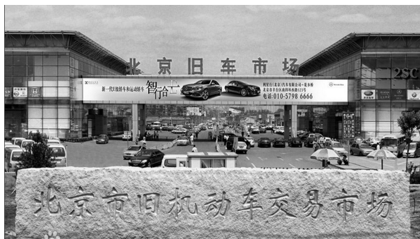
图 1-1 北京市旧机动车交易市场大门

北京市旧机动车交易市场简称北京旧车市场(见图1-1),成立于1985年,因地处北京南四环花乡桥又多被称为花乡二手车市场,是集二手车展示销售、拍卖、鉴定评估和交易过户等一站式服务的超大型专业二手车交易市场。市场占地500亩,驻场二手车公司580余家,场内常年在库销售二手商品车10000余辆,日更新率5%,2013年二手车过户交易量达45万辆。