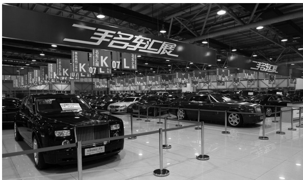
图 1-2 北京花乡二手车交易市场名车汇展区

(2)二手车精品展区(G区:6.2万平方米)。二手车公司90余家,经营面积300~2500平方米不等,统一规划建设为层高5米的联排独立展销厅。该展区可容纳二手商品车1500辆左右,平均价格30万元以上,主要经营品牌奔驰、宝马、奥迪、路虎、雷克萨斯、英菲尼迪和捷豹,等等。