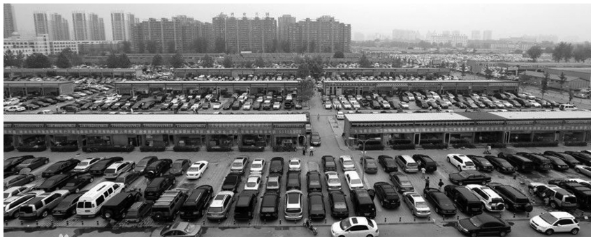
图 1-3 北京花乡二手车交易市场普通展区

(3)二手车普通展区(A~D、F区、G9区:9万平方米)。二手车公司300余家,每家公司为20~100平方米办公接待用房,12~50个销售车位,该展区可容纳二手商品车3500辆左右,价格在10万~20万元之间,主要经营进口及国产中档二手车。如图1-3所示为该交易市场的普通展区缩影。