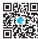
我国二手车交易市场现状与发展前景