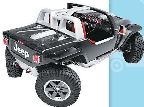
图 1-12 四轮转向的汽车

车辆在最小面积内转向和转弯的能力被称为车辆的机动性。它也表征了汽车能够通过狭窄弯曲地带或绕开不可越过障碍物的能力。车辆装卸货场地的尺寸、停车库（场）通道宽度、车辆维修作业所需的场地面积都与车辆的机动性有关。图 1-12 为装备四轮转向系统的汽车（4WS），可以极大改善汽车的转向和行驶。