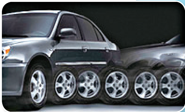
图 1-13 配备 ABS 系统的汽车

所谓被动安全性指的就是一旦事故发生时，汽车保护内部乘员及外部人员的安全程度。被动安全性必须要考虑