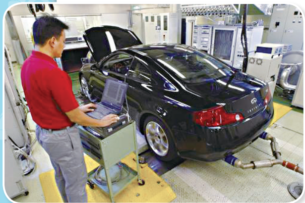
图 1-15 汽车性能检测

汽车从发明到今天已经一个多世纪了。在现代社会，汽车已成为人们工作、生活中不可缺少的一种交通工具。汽车在为人们造福的同时，也带来大气污染、噪声和交通安全等一系列问题。汽车本身又是一个复杂的系统，随着行驶里程的增加和使用时间的延续，其技术状况将不断恶化。因此，一方面要不断研制性能优良的汽车（图 1-15 为研究机构进行汽车性能检测）；另一方面要借助维护和修理，恢复其技术状况。汽车综合性能检测就是在汽车使用、维护和修理中对汽车的技术状况进行测试和检验的一门技术。