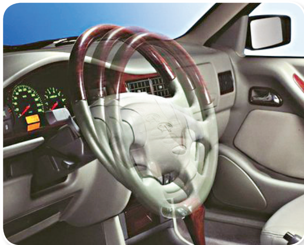
图 1-4 可调方向盘