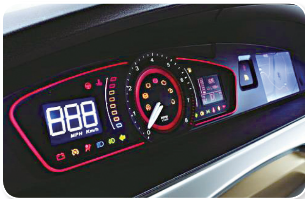
图 1-5 荣威 550 汽车的仪表台

为了提高汽车的操纵轻便性，各种操纵机构应有良好的接近性，应设置速度、机油压力、油、冷却液温度、燃料耗量以及电参数等的显示仪表。当控制参数进入临界值时，发出声、光信号，以便驾驶员能及时掌握车辆状况。控制显示仪表应具有必需的显示精度，以利于驾驶员观察。图 1-5 为荣威 550 精心设计的仪表台。