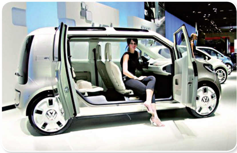
图 1-6 采用对开门的汽车

对于轿车，主要取决于车门支柱的布置。特别是两门轿车保证后座出入方便的影响尤其明显。车门支柱倾斜适当，可改善乘客出入的方便性，如果采用对开门可以极大方便乘员的上下车，如图 1-6 所示。