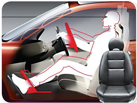
图 1-10 符合人体工程学驾驶位

另外，乘坐舒适性也与车身的密封性有关。保护乘员空间不受发动机气体排放物的污染，防止尘土侵入，保暖、供冷、通风、调温等，也是提高客车舒适性的重要措施。如图 1-11 所示。