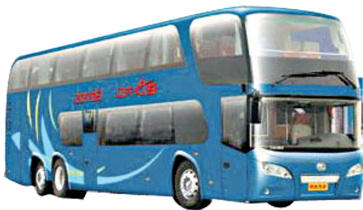
图 1-1 中大 6140HGD 豪华双层客车