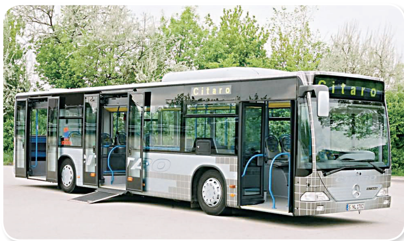
图 1-7 方便乘客上下的客车

对于客车，主要取决于踏板高度、深度、级数、能见度及车门的宽度。踏板高度和深度应与日常生活中所习惯的楼梯台阶相同。有的国家城市公共汽车，为了方便残疾人轮椅和童车的上下，公共汽车的踏板设计成高度可调或自动升降式，如图 1-7 所示。如果乘客上下车方便会减少城市公共汽车站点的停车时间，缩短汽车的线路运行时间。