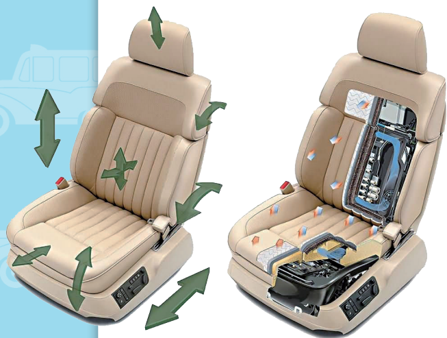
图 1-3 可调自加热座椅

驾驶员座椅的构造和操纵杆件的配置是否舒适方便，也影响汽车使用方便性。为了保证不同身高的驾驶员都能有适合的驾驶操作姿势，驾驶座椅设计成可沿着水平和垂直方向调节式，并且座椅的和靠背倾角也可调节，即驾驶座椅应具有多维调节的功能，如图 1-3 所示为可调自加热座椅。方向盘的位置还应按着驾驶员的需要调节，图 1-4 所示为可调方向盘。