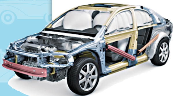
图 1-14 VOLVO S40 安全设计

两方面的问题：一个是汽车外部安全性，另一个就是汽车内部安全性。在外部安全性方面，应减少凸出物体，物体外形采用圆弧形，增大点接触面等方式，尽量在发生事故时减少对外部人员的伤害。在内部安全性方面，应减少对车内乘员的冲击力，事故发生后能提供足够的生存空间而专门设计的防范措施，例如高强度车厢结构、保险杠等汽车自我保护方式，以及安全带、安全气囊等辅助安全设备。