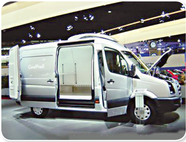
图 1-8 奔驰凌特新式厢式货车

图 1-8 为奔驰凌特新式厢式货车，其后门单扇可开启 270°，货舱侧的拉门又宽又高，拉门门口宽度达 1510 mm，高度达 2175 mm。乘员可不必弯腰进出，也可直立在货舱内移动货物，装卸货物非常方便。