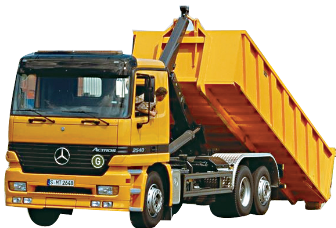
图 1-2 改装后整备质量增加的自卸汽车

平头汽车的整备质量利用系数一般比长头汽车的高。由货车变形的自卸汽车，因改装后整备质量的增加，整备质量利用系数比基本型汽车的低，如图 1-2 所示。