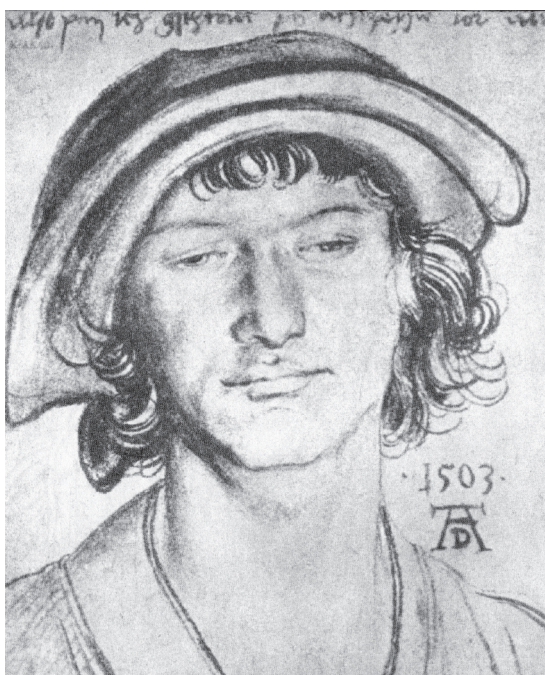
图 0-8 青年人像 丢勒 德国