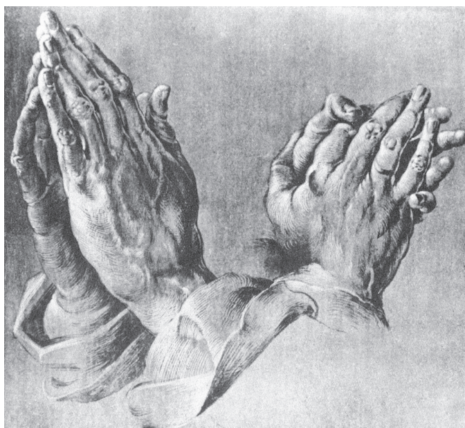
图 0-23 祈祷之手 丢勒 德国