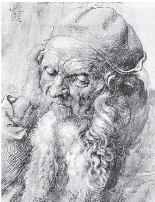
图 0-14 九十三岁老人像 丢勒 德国