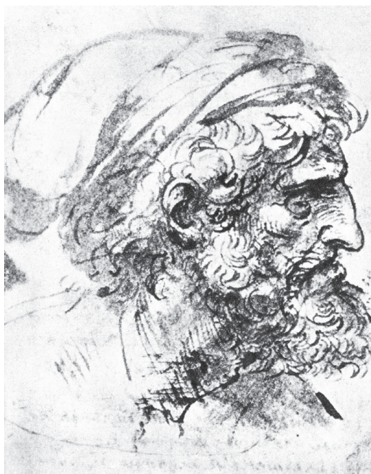
图 0-13 老人头像 达·芬奇 意大利