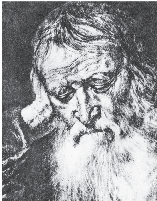
图 0-17 老人像 萨伏尔多 意大利