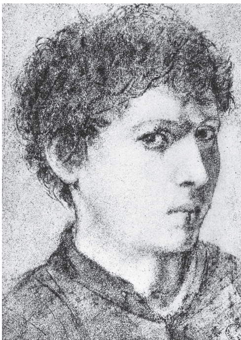
图 0-12 男孩头像 萨伏尔多 意大利