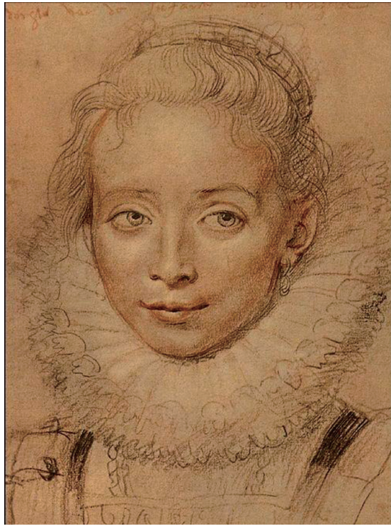
图 0-9 少女像 鲁本斯 德国