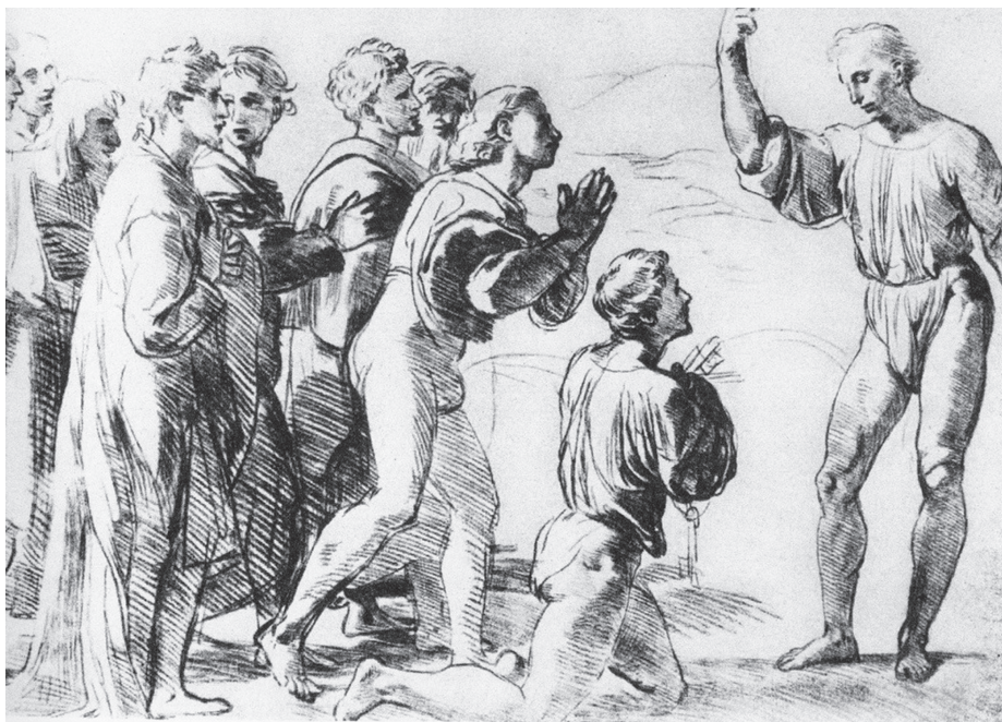
图 0-4 基督把钥匙给彼得 拉斐尔 意大利