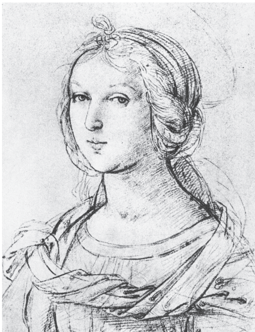
图 0-10 年青女子肖像 拉斐尔 意大利