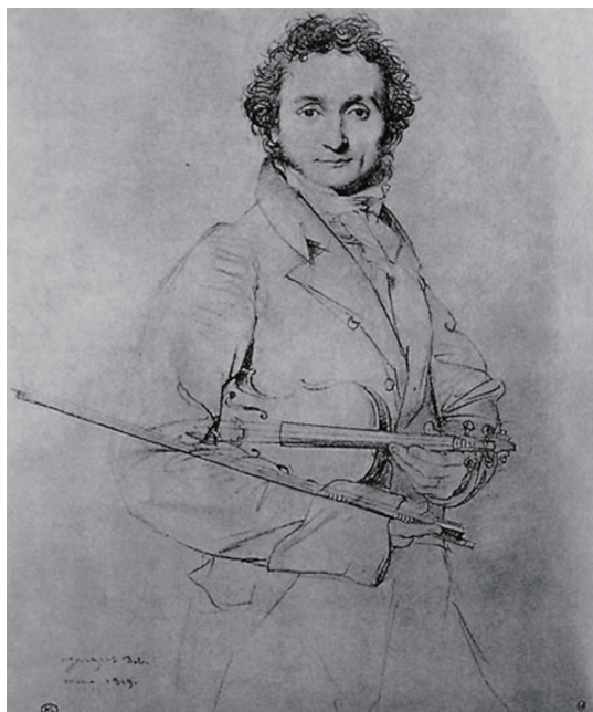
图 0-1 帕格尼尼像 安格尔 法国