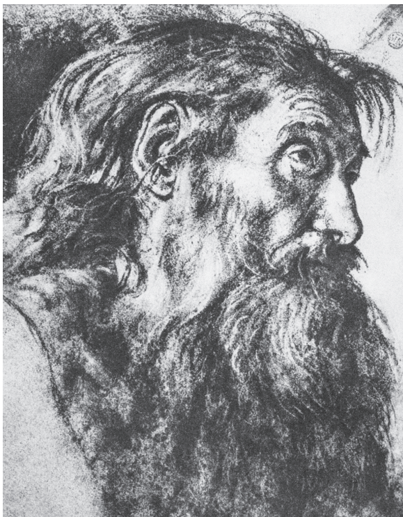
图 0-19 圣西罗尼摩斯头像习作 萨伏尔多 意大利