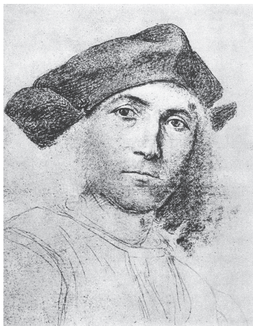
图 0-7 青年男人像 劳伦佐 意大利