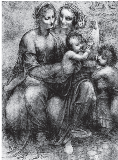
图 0-21 圣母子、圣安娜和小约翰 达·芬奇 意大利