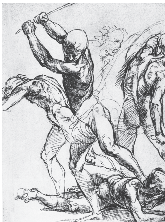
图 0-5 斗士 拉斐尔 意大利