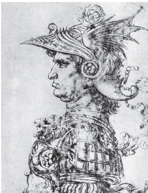
图 0-6 戴头盔的战士 达·芬奇 意大利