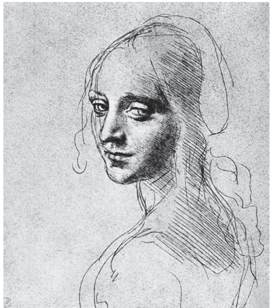
图 0-16 岩间圣母 达·芬奇 意大利