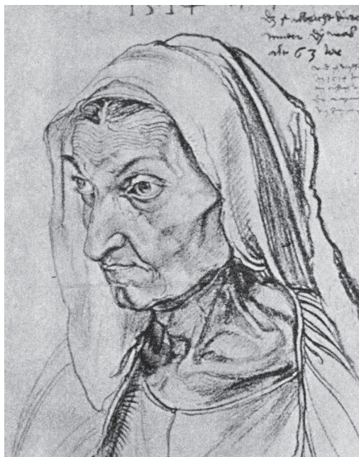
图 0-2 画家母亲像 丢勒 德国