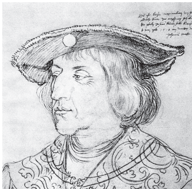
图 0-18 马克西米利安一世 丢勒 德国