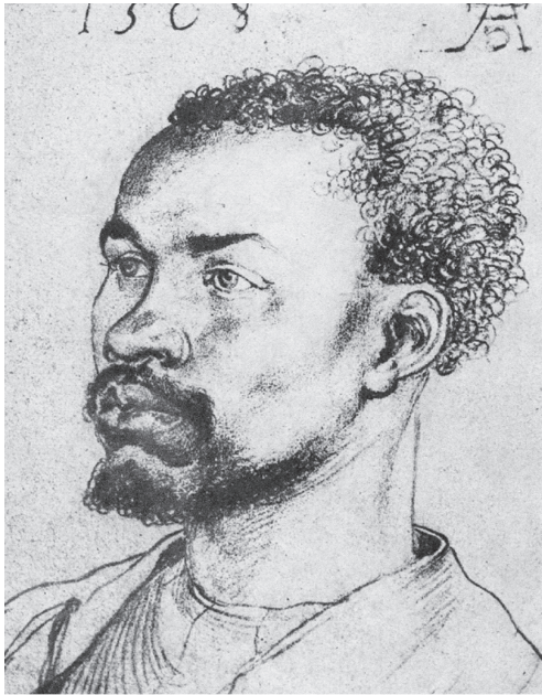
图 0-15 黑人头像 丢勒 德国