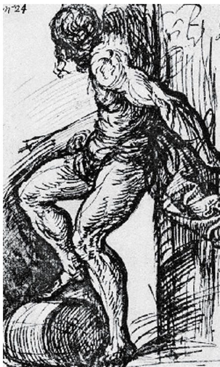
图 0-20 圣赛巴蒂安 提香 意大利