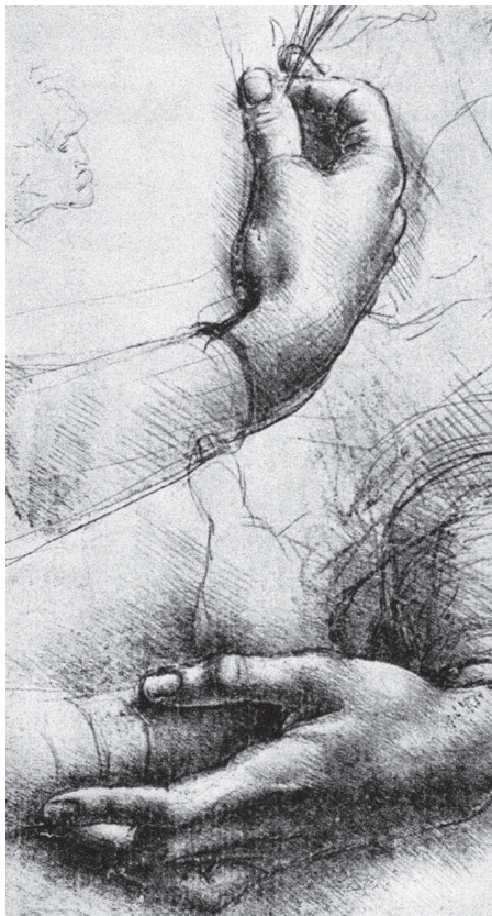
图 0-22 妇女手的习作 达·芬奇 意大利