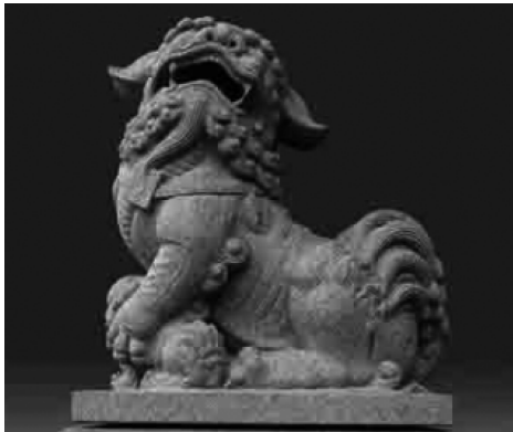
图 1-4 石麒麟

为做大、做强嘉祥石雕品牌,嘉祥县建立了嘉祥石雕文化产业园,嘉祥石雕迎来了石雕产业发展新机遇。如今,嘉祥石雕由单纯的手工艺上升为一种独具特色的石文化,创作手