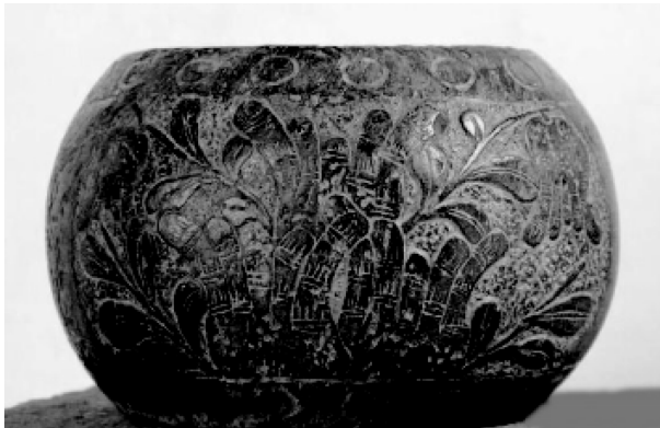
图 1-3 石鼓

改革开放后,嘉祥石刻艺术得到恢复和发展。雕刻的产品主要有人物石像、石狮、石鹿、石马、石鼓(见图 1-3)、石桌、蒜臼子、门枕、门卡石、石麒麟(见图 1-4)等,除装饰园林、公共场所和庭院外,还广泛用于农村建房。杜宗美刻制的成对微星石狮,已被中国美术馆收藏。杜运标雕刻的石麒麟重达 10 吨,安放在县城青年路北首,成为县标。嘉祥武氏墓群石雕研究所生产的石雕工艺品有 100 多个品种,设计精巧、雕刻细腻,既保持了中国传统的民间石雕艺术风格,又有独特的创新之处,在青岛、北京和日本东京的展览会上受到专家学者的青睐,孟蒙、郝治、石可等 30 多位工艺美术界专家分别题字作画高度赞扬,不仅在国内销售至 10 多个省市,而且进入了东南亚、日本、美国等国际市场。