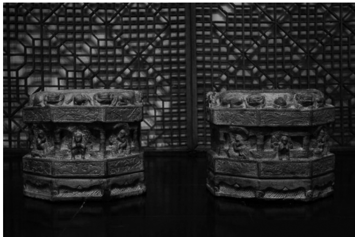
图 1-2 明代石雕