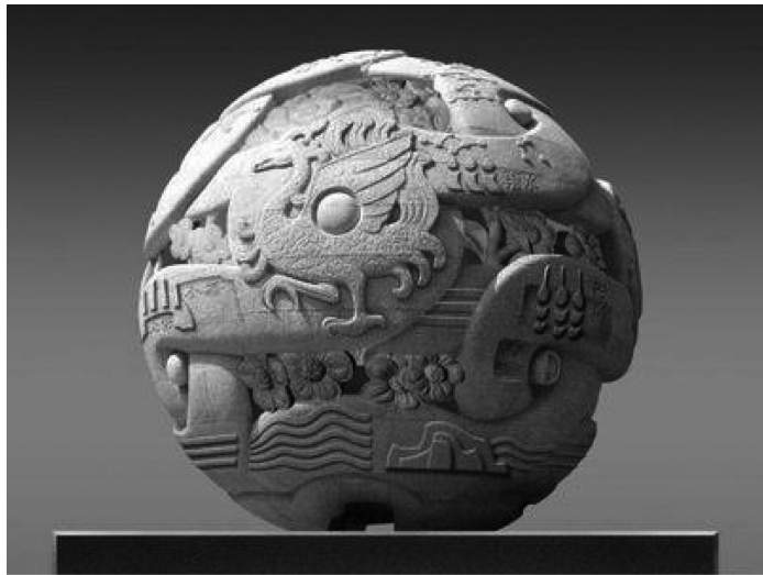
图 1-1 圆雕

随着历史的推移,嘉祥的石刻艺术不断演化和发展,隋唐时期达到一个新的高度。嘉祥天青石本身适于案头雕刻,或寺庙之中佛像的雕凿。随着佛教文化在中原大地的盛行,嘉祥石雕逐渐由浮雕转向圆雕(见图 1-1),技法由平刀块面转向圆刀细琢,作品也逐渐扩散到周边更广阔的地域。