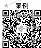
学车考驾照流程详解

找个地方打一个月工或者尝试一些小型的创业。在打工中体味生活，接触社会各阶层的人，积攒些社会经验。勇敢走进社会，对于刚刚经历了高考的同学们来说，经验就是宝贵的财富，社会上有很多办学机构也需要这样的老师，因此利用暑假找一份家教的工作，从假期开始养活自己，培养独立生存的能力。