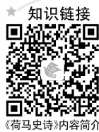
《荷马史诗》内容简介

第三阶段即文艺复兴时期,这一时期人文主义大行其道,人文主义者主张一切以“人”为本来反对神的权威,用个性解放反对禁欲主义,用理性反对蒙昧主义。在诗体上,抒情诗繁荣发展,十四行诗成了欧洲重要的诗体。此时出现的伟大诗人有英国的莎士比亚、意大利的彼特拉克等。彼特拉克的《诗集》包括了366首十四行诗和抒情短诗,莎士比亚有两部长诗