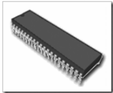
图 1-5 集成电路