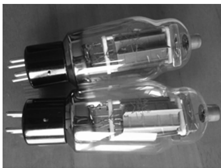
图 1-3 电子管