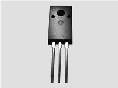
图 1-4 晶体管

该时期,系统软件有了很大发展,出现了分时操作系统和会话式语言,采用结构化程序设计方法,为研制复杂软件提供了技术上的保证。