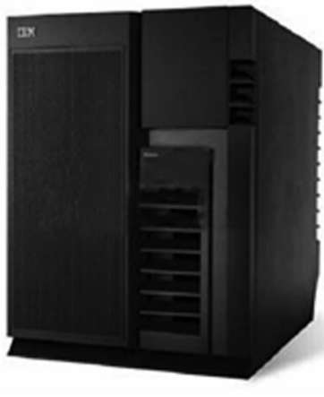
图 1-10 RS/6000 小型机