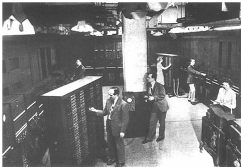
图 1-1 ENIAC

世界上第一台计算机 ENIAC(Electronic Numerical Integrator And Computer),如图 1-1 所示,于 1946 年 2 月诞生于美国宾夕法尼亚大学,是美国物理学家莫克利(John Mauchly)教授和他的学生埃克特(Presper Eckert)为计算弹道和射击表而研制的。它以电子管为主要元件,其内存为磁鼓,外存为磁带,操作由中央处理器控制,使用机器语言编程,主要应用于数值计算。