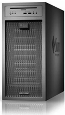
图 1-11 Sun 工作站

个人计算机(Personal Computer):简称 PC,它是 20 世纪 70 年代出现的新机种,以设计先进(总是率先采用高性能微处理器)、软件丰富、功能齐全、价格便宜等优势而拥有广大的用户,因而大大推动了计算机的普及应用。现在除了台式外,还有笔记本、掌上型、手表型等,如图 1-12 所示。