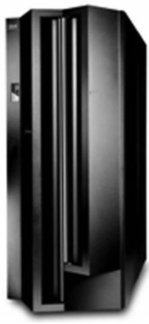
图 1-9 IBMSystem z 系列大型机

小型机(Minicomputer):小型机结构简单、价格较低、使用和维护方便,备受中小企业欢迎。20 世纪 70 年代小型机很热,到 20 世纪 80 年代其市场份额已超过了大型机。在中国,小型机习惯上用来指安装了 UNIX 系统的服务器,比如 IBM 曾经生产的 RS/6000(见图 1-10)。