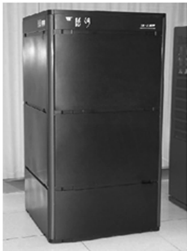
图 1-7 银河Ⅲ巨型机

格大幅降低(约为巨型机价格的十分之一)。在技术上则采用高性能的微处理器组成并行多处理器系统,使巨型机小型化。我国在 1989 年 11 月 17 日推出了第一台小巨型电子计算机 NS1000(见图 1-8),由北京信通集团和北京大学计算机系合作研制成功。