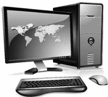
图 1-12 个人计算机