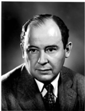
图 1-2 冯·诺依曼

第一代计算机还没有系统软件,用机器语言和汇编语言编程。这时的计算机只能在少数尖端领域中得到应用,如科学、军事和财务等方面。尽管存在这些局限性,但它却奠定了计算机发展的基础。