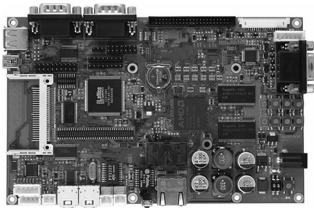
图 1-6 超大规模集成电路

第四代计算机的主要元件是大规模与超大规模集成电路(见图 1-6)。在一个几平方毫米的硅片上,至少可以容纳相当于几千个晶体管的电子元件,集成度很高的半导体存储器完全代替了磁芯存储器,磁盘的存取速度和存储容量大幅度上升,开始引入光盘,外部设备的种类和质量都有很大提高,计算机的运算速度可达每秒几百万至上亿次。计算机的性能价格基本上以每 18 个月翻一番的速度上升(即著名的 Moore 定律)。这些以超大规模集成电路构成的计算机日益小型化和微型化,应用和发展的更新速度更加迅猛,其产品覆盖巨型机、大/中型机、小型机、工作站和微型计算机等各种类型。