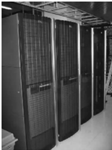
图 1-8 NS1000 小巨型机

大型机(Mainframe):国外习惯上将大型机称为主机,它相当于国内常说的大型机和中型机。近年来大型机采用了多处理、并行处理等技术,其运行速度可达 300~750MIPC(每秒执行 3 亿至 7.5 亿条指令)。大型机(见图 1-9)具有很强的管理和处理数据的能力,一般在大企业、银行、高校和科研院所等单位使用。