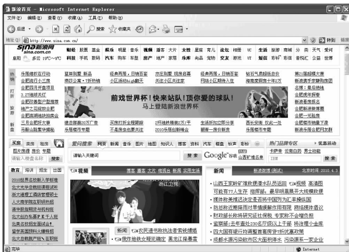
图 1-8 网页中的动画

在网页中添加动画,可以让浏览者更乐意浏览该网页。特别是一些制作优美的动画,更能为网页增色不少,吸引浏览者的目光。动画文件一般有 GIF 动画、Flash 动画等,如图 1-8 所示。