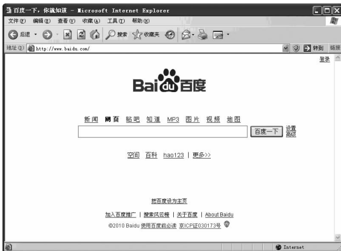
图 1-1 一个网页