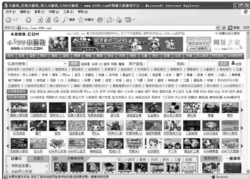
图 1-5 游戏网站