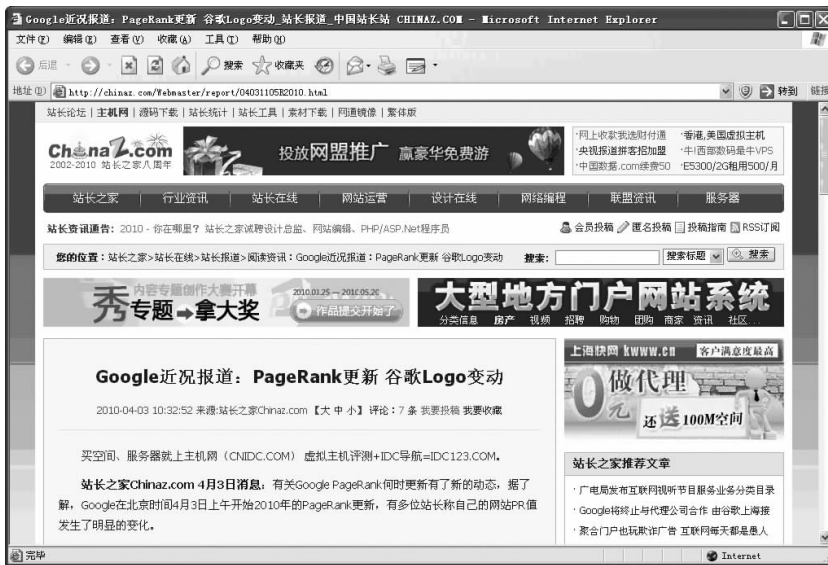
图 1-13 上左右型网站