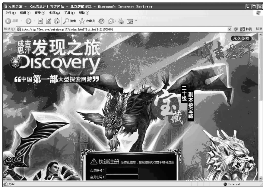
图 1-11 游戏网站

一个网站会给浏览者留下某个特定的印象,这是由网站的风格决定的。不同的网页布局加上不同的色彩与文字搭配就形成了不同风格的网站。下面这个网站是一个专门的游戏网站,它的风格就体现在鲜明的人物风格和浓厚的梦幻色彩的运用,如图 1-11 所示。