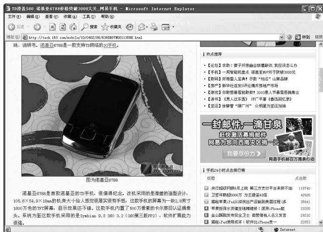
图 1-7 网页中的图像

网页中的图像可以生动直观地传递和表达各种信息。图像可以用最直观的方式表现网页的主题,并以强烈的视觉冲击给予浏览者深刻的印象。在网页中合理地使用图像,可以使网页更加容易被人们欣赏和接受,如图 1-7 所示。