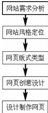
图 1-10 网站开发流程图

前面学习了网页的一些基础知识,知道了什么是网页,什么是网站,网页是由哪些元素构成的。下面来了解一下应该怎样去开发建设一个网站,如图 1-10 所示。