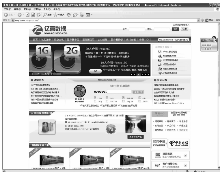
图 1-14 左中右型网站