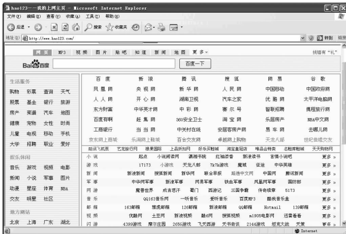
图 1-9 采用表格布局的网页

一个网页除了要有精彩的内容与协调的色彩外,还需要进行合理地排版布局。表格的主要作用就是对网页进行排版和布局,如图 1-9 所示。