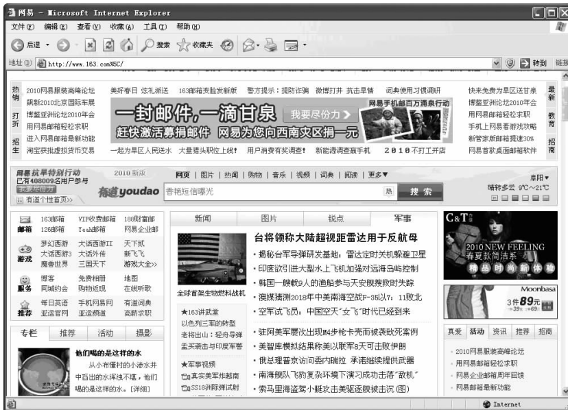
图 1-12 上左中右型网站