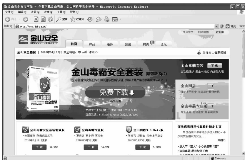
图 1-3 反病毒职能网站