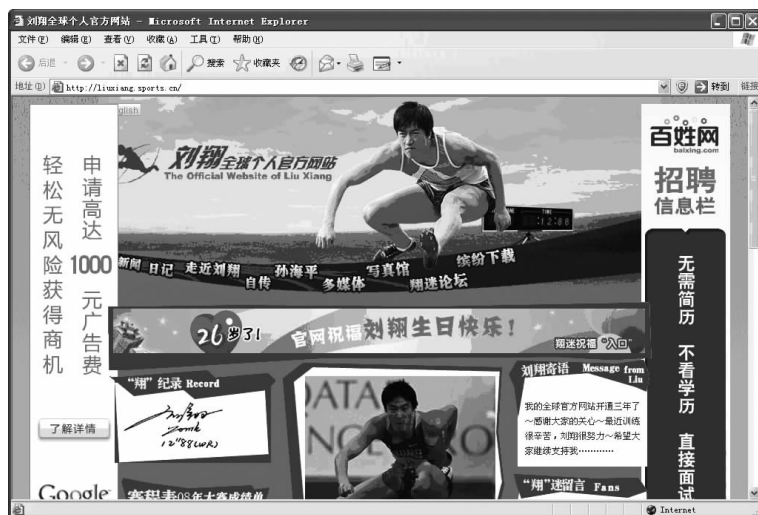
图 1-4 个人网站