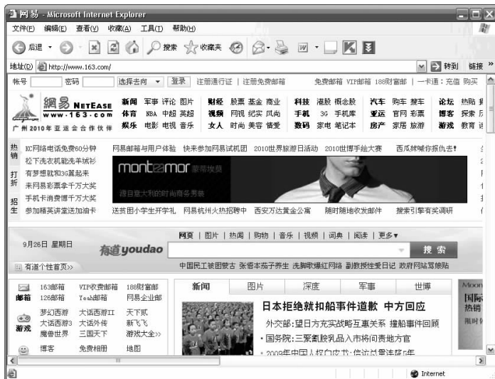
图 1-2 网易门户网站