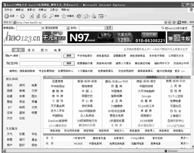
图 1-18 网页中包含文字、图片、动画等元素