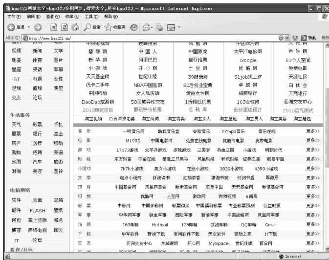
图 1-17 “hao123”网页