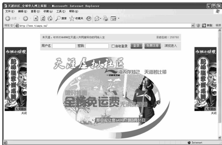
图 1-15 满版型网站

该类型的网页版式没有明显的分界形式,通常由一幅整体的图像或是一个 Flash 动画完成网页内容的安排,个人网站和一些特色站点多采用此类版式,如图 1-15 所示。