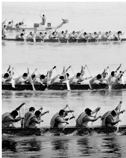
图 1-1 伯都讷端午文化旅游节的龙舟竞赛

到目前为止,伯都讷端午文化旅游节已经成功举办四届。民俗、宗教、人文、地域等多元文化的融合,使伯都讷端午文化旅游节已经成为宣传松原、推介松原的一张文化名片。这一切,是宁江区委、区政府敏锐把握全国端午文化氛围越来越浓的大趋势,不失时机地推陈出新,全力打造伯都讷端午文化旅游节的结果,同时也昭示了宁江民间民俗文化为经济建设服务和可供开发利用的巨大潜力。今年,宁江区再次秉承做强文化旅游产业、助推经济发展的