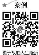
勇于战胜人生挫折

青年时期是人生问题发生的高峰期,在复杂的社会生活中,他们难免会遇到挫折、逆境、失足、失意、失败、痛苦、冤屈、不幸、讥讽等人生问题。在这些问题上,中职生应通过学习人生哲学,从中汲取精神力量,树立正确的人生观,振作精神,重整旗鼓,奋力拼搏,开辟新的人生境界。